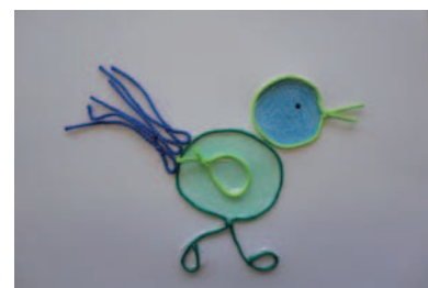
Aus Anfangsschlingen lassen sich Bilder gestalten.