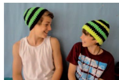
... eigene Mützen.