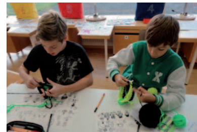
Cooler Jungs häkeln ...

Sobald an beiden Enden gleichzeitig gezogen wird, öffnen sich die Anfangsschlingen und dann «knallts», was die Schülerinnen und Schüler anspricht.