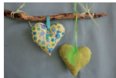
Die Herzform eignet sich gut zum Verstürzen.

Achtung: Die Schülerinnen und Schüler beim Ein- oder Zurückschneiden gut überwachen und wiederholt kommunizieren, dass nur bis 2 mm vor die Nählinie geschnitten werden darf.